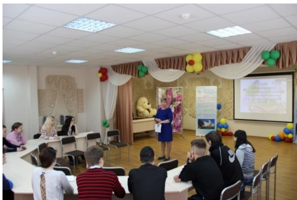
2018 г. «Способы коммуникативного взаимоотношения», студенты Камского строительного колледжа имени Е. Н. Батенчука