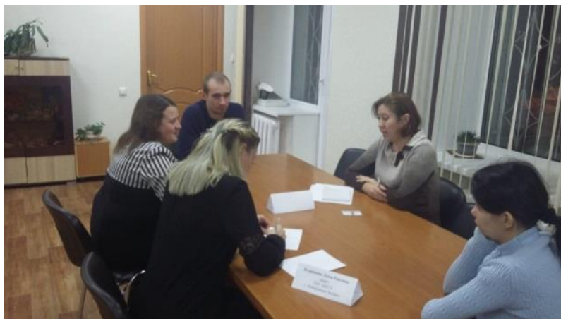
Совместные круглые столы