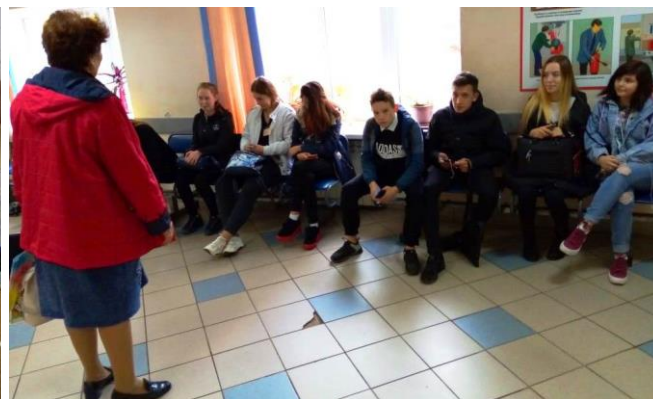
2019 г. «Формирование социально-полезного поведения в социуме совместно с органами социальной защиты», студенты Камского строительного колледжа имени Е. Н. Батенчука