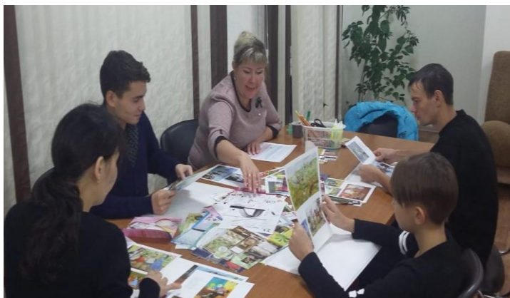
Техника коллаж «Проекция будущего», выпускники с ОВЗ