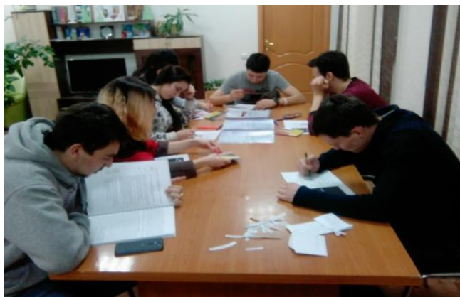
«Колесо жизни», выпускники с ОВЗ